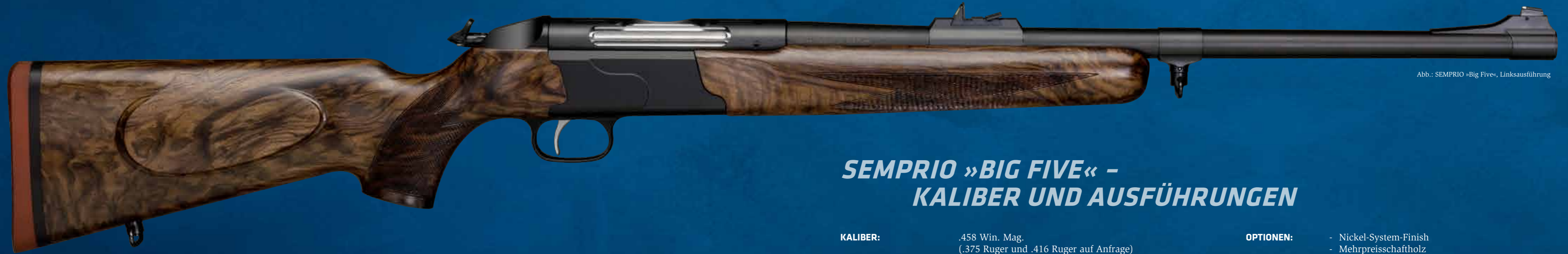
Abb.: SEMPRIO »Big Five«, Linksausführung