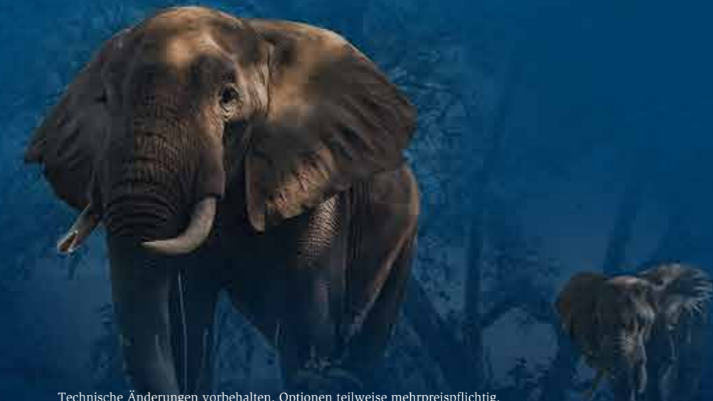
Technische Änderungen vorbehalten. Optionen teilweise mehrpreispflichtig.

4 »Big Five«-Schaft Der SEMPRIO »Big Five«-Schaft bietet alles, was man von einer klassischen Safaribüchse erwarten darf: Deutsche Backe, gerader Schaftrücken und die traditionell rote Schafthkappe. Der kräftig anmutende Vorderschaft ist für optimalen Halt dem Kaliber entsprechend dimensioniert.