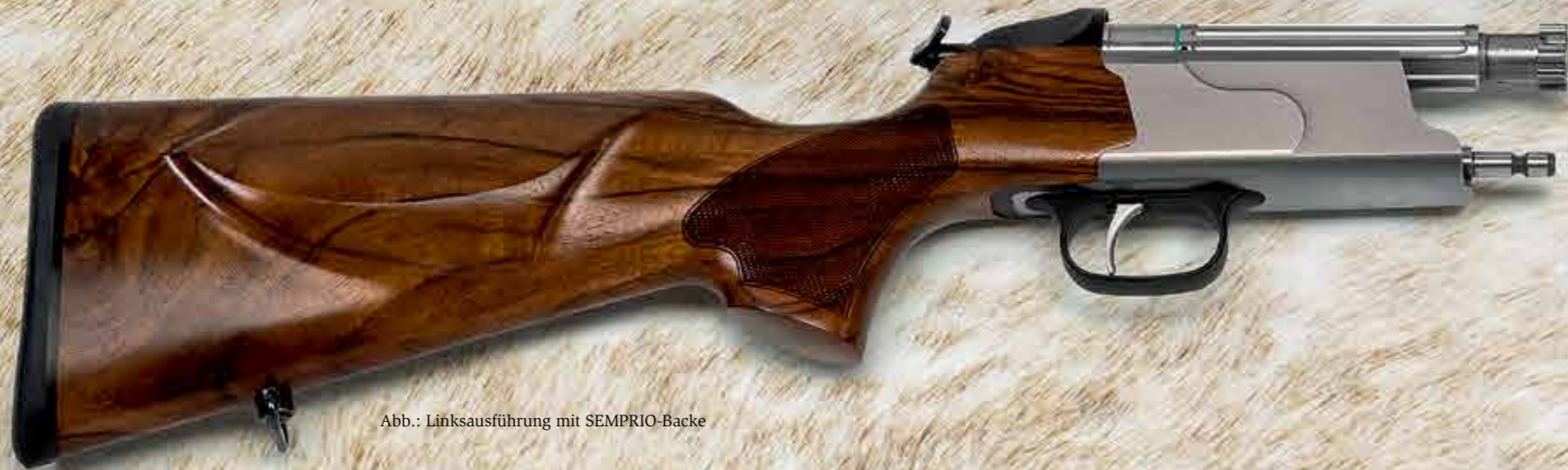
Abb.: Linksausführung mit SEMPRIO-Backe